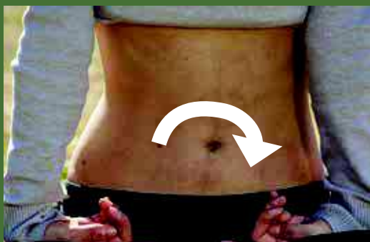
Zdj. 3A–C. Zatrzymanie oddechu dżbanowego i wykonanie krążenia brzuchem

nym, zgina kręgosłup do przodu oraz obniża żebra, powodując wydech.