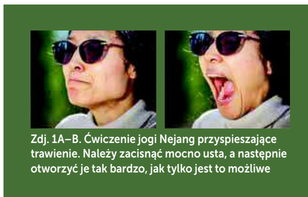
Zdj. 1A–B. Ćwiczenie jogi Nejang przyspieszające trawienie. Należy zacisnąć mocno usta, a następnie otworzyć je tak bardzo, jak tylko jest to możliwe

Nerw twarzowy będący nerwem czaszkowym jest jednym z ośrodków układu przywspółczulnego znajdującego się w pniu mózgu. Oprócz niego znajdują się tutaj: jądro nerwu okoruchowego (III), jądro nerwu językowo-gardłowego (IX) oraz jądro nerwu błędnego (X). Zwraca się też uwagę, że w ontogenezie stanowią one grupę tzw. nerwów łuków skrzelowych. Unerwiają one łuki skrzelowe, czyli struktury występujące w rozwoju ontogenetycznym ssaków, dające początek różnym strukturom głowy i szyi. Nerwy te sąsiadują anatomiczne oraz