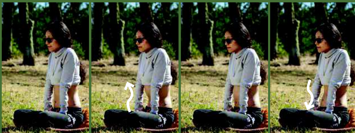
Zdj. 2A–D. Uruchomienie brzucha pionowo ruchem falującym

Mięsień skośny zewnętrzny brzucha leży powierzchownie na przednio-bocznej ścianie dolnego odcinka klatki piersiowej oraz brzucha. Przebiega od dolnej połowy żeber do kości biodrowej poprzez więzadło pachwinowe do kresy białej z przodu ciała. Mięsień ten zgina bocznie oraz skręca tułów w skurczu jednostron-